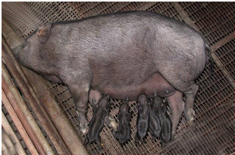
哺乳中的蘭嶼豬 GPI-CRC-PGD 基因型純合品系。