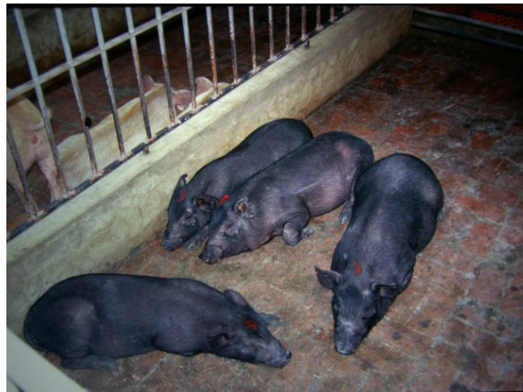
育成階段（田間試驗場）