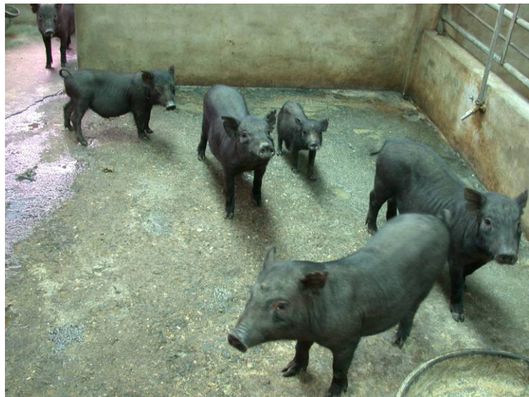
GPI-CRC-PGD 基因型純合品系之選留豬群。