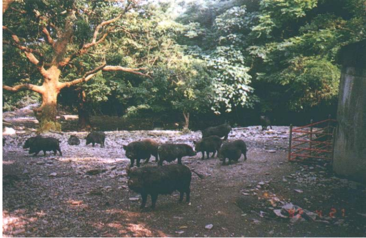
原代源自蘭嶼豬保種族群。