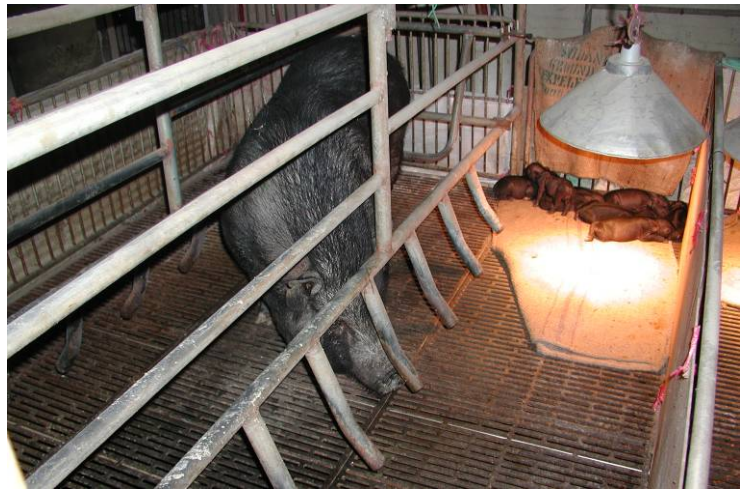
生產與哺乳情形（田間試驗場）