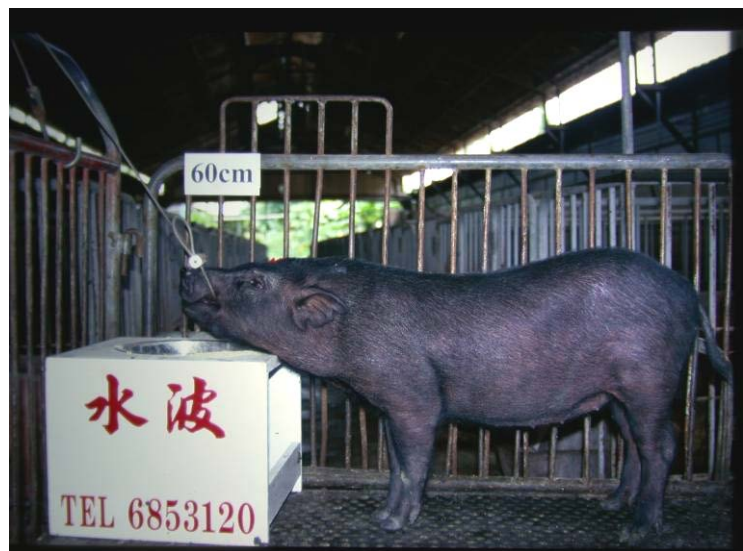
五月齡體型測量（田間試驗場）